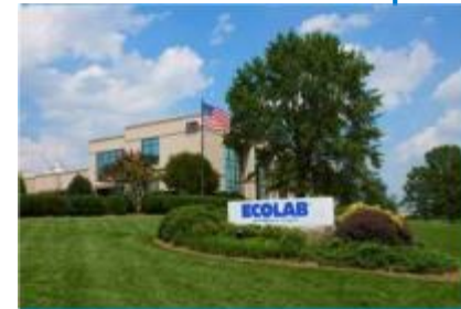
QSR Sede en Greensboro, Carolina del Norte