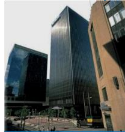
Global Headquarters St. Paul, MN

15 R&D centros de innovación a nivel mundial